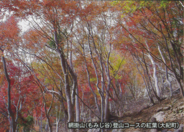
網掛山(もみじ谷)登山コースの紅葉(大紀町)